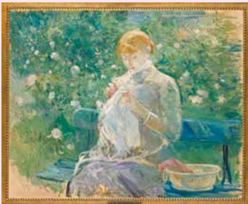
Berthe Morisot, Paisie cousant dans le jardin de Bougival, 1881