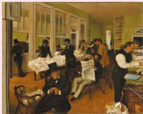
Edgar Degas, Le bureau de coton à la Nouvelle Orléans, 1873