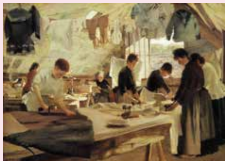
Louis Joseph Anthonissen, Atelier de repasseuses à Trouville, 1888