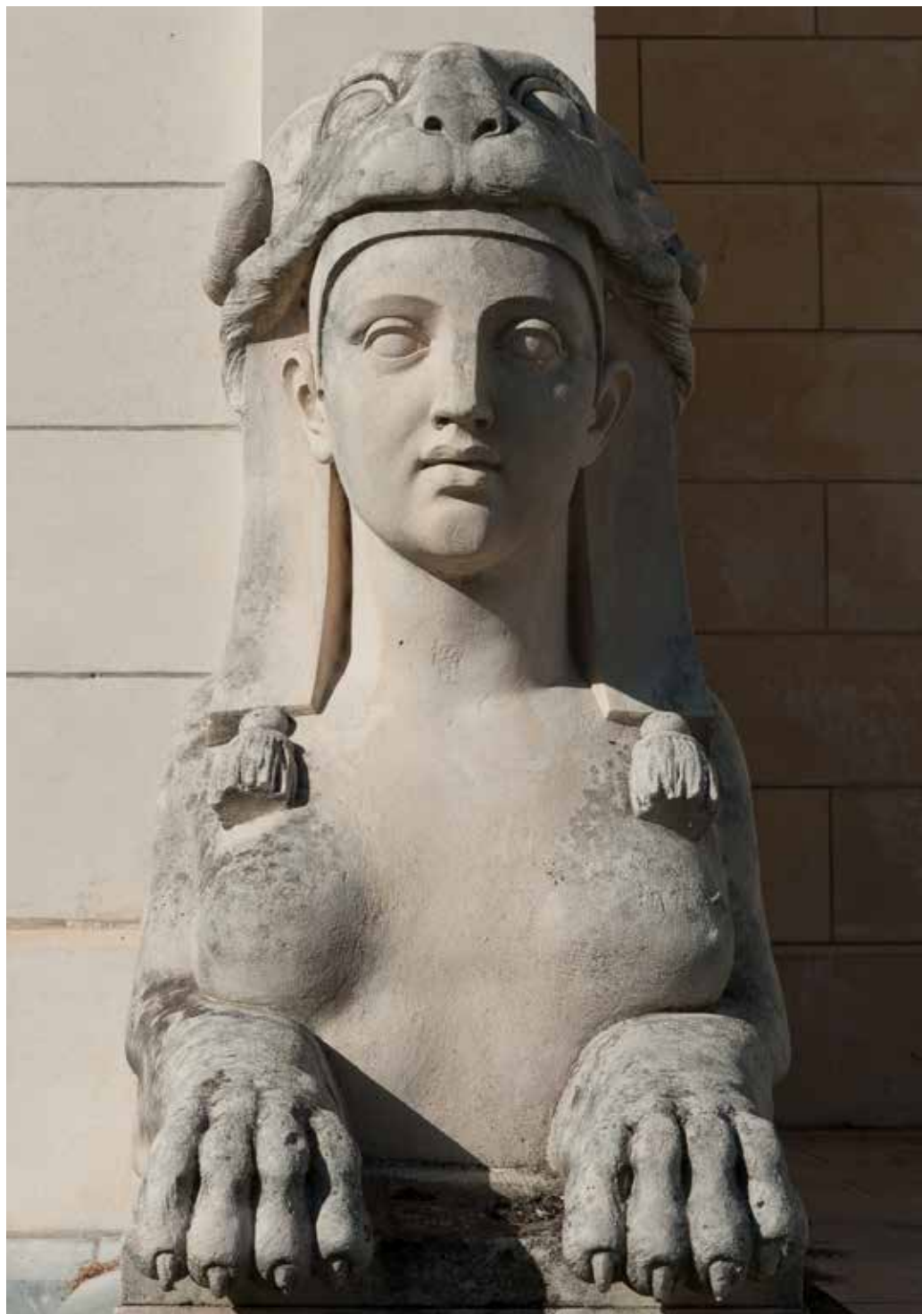
Sphinge, Villa Ridgway à Pau