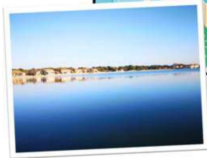
Lac marin 2min à pied