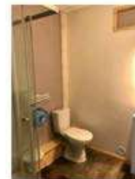
Chambre 21 lit superposé avec sanitaire - RDC