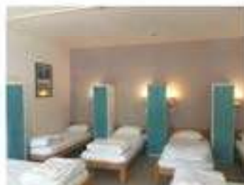
Chambre 27 - 8 lits avec sanitaires - RDC