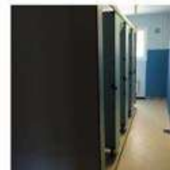
Chambres à 7 ou 8 lits - sanitaires commun - étage