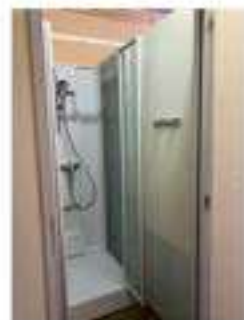
Chambres - sanitaires