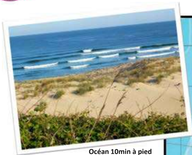
Océan 10min à pied