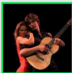
« World Fusion »

Guitares acoustiques et électriques - Instruments du Monde - Voix - Danse Contemporaine -