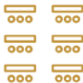
ECOLE 18 PERSONNES