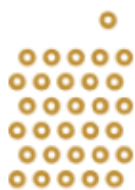
THEATRE 25 PERSONNES