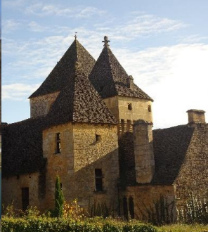
Toits de lauzes du bourg de Saint-Geniès