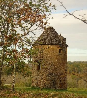
Pigeonnier au Pech d'Albet