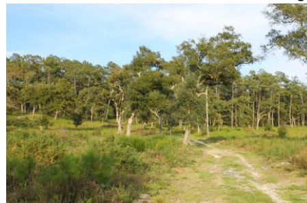
Forêt de chênes lièges

Ce circuit, situé en forêt communale, vous fera voir les différents peuplements de pins maritimes de tout âge en mélange avec principalement le chêne-liège et le chêne pédonculé.