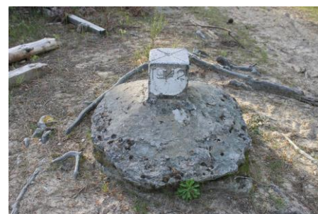
Borne géodésique datant de 1942

3 Faites une petite halte au bord d'un petit étang pour profiter de la vue et écouter les animaux de la forêt.