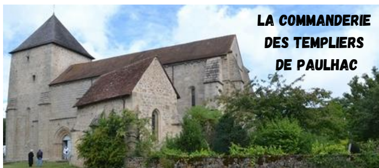
LA COMMANDERIE DES TEMPLIERS DE PAULHAC