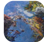
Sylvie POIRSON Nature autour de l'eau