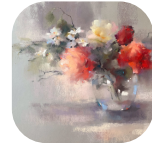
Oléna DUCHÈNE Forme, lumière et contraste