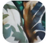
Michel LECLERCQ Rendu des matières et du grain de la peau