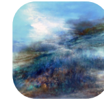
Jean-Claude BAUMIER Paysage - Création - Rêves