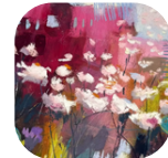
Nathalie AZMI Paysages créatifs