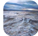
Alain VOINOT Entre ruisseaux et marines - Pastel sur fond noir