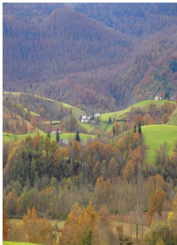
Paysage du piémont

1h20 6 706252E - 4778397N puis à droite rue Casamayou pour rejoindre la Place du Prat.