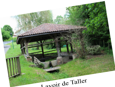
Lavoir de Taller

Taller est un petit village de charme situé un peu plus à l'intérieur des terres. Village d'histoire, Taller est cité dans l' « Itinéraire d'Antonin » et a été vraisemblablement traversé par Charlemagne et son neveu Roland pour rallier Roncevaux. Quelques années plus tard, il aurait été le théâtre d'affrontements sanglants entre des vikings venus voir si l'herbe était plus verte ici et les armées de Guillaume Sanche, duc de Gascogne. Un extrait de cartulaire des moines de Saint-Sever en fait état constatant que « longtemps après la bataille, il y avait encore dans cette plaine désertique [située juste au nord de Taller] plus d'ossements blanchis que d'herbes verdoyantes ». Preuve s'il en faut que l'herbe était très verte, dommage pour les vikings. Mais depuis, la nature a repris ses droits, laissant place à un cadre idéal pour les visites et les sorties de plein air. Son église du XVIème siècle, son lavoir ou encore sa salle de réunion construite sous le crayon d'Albert Pomade valent le détour.