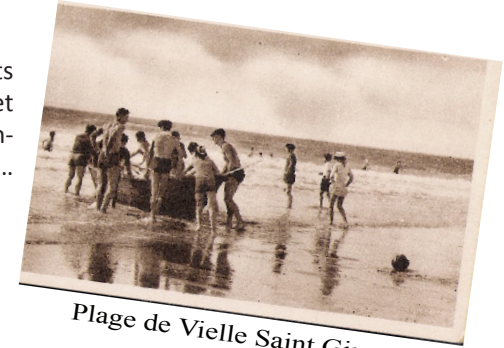
Plage de Vielle Saint Girons