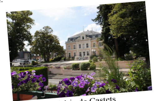
Mairie de Castets