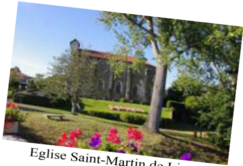
Eglise Saint-Martin de Linxe