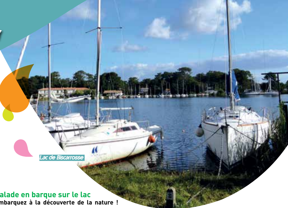
Lac de Biscarrosse