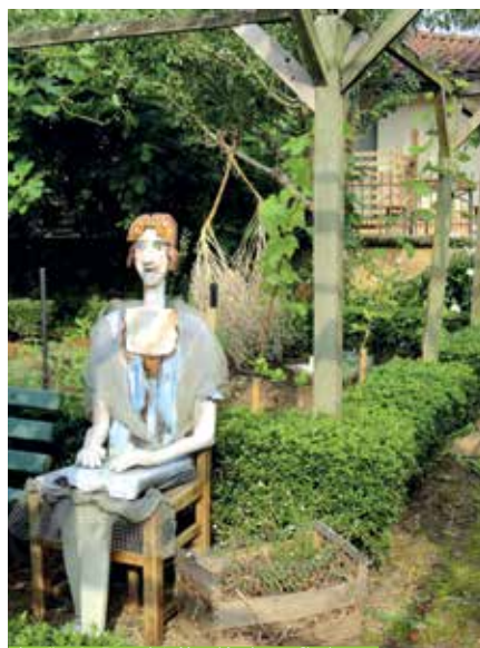
Jardin de Payot à Montfort-en-Chalosse