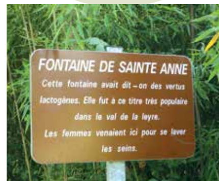
Fontaine Sainte-Anne à Belhade

A l'instar de nombreuses communes landaises, Belhade possède sa fontaine miraculeuse. Située à une centaine de mètres derrière l'église, dans un écrin de verdure frais et reposant, la fontaine Sainte-Anne aurait des vertus lactogènes très prisées par les femmes autrefois.