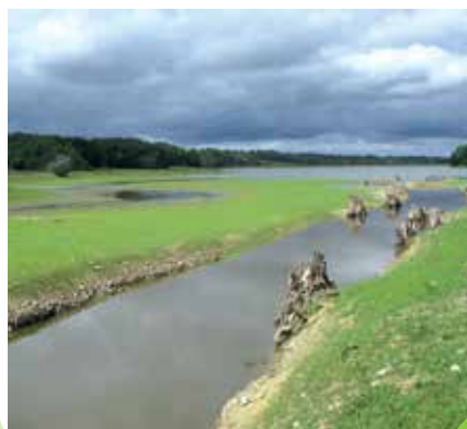
Lac du Brousseau à Aire-sur-l'Adour

Le bois d'Aire vous offre une promenade paisible sur un sentier de découverte qui permet d'apprécier différentes espèces végétales. Vous pourrez partir à la découverte de la flore sur un parcours de 3 km.