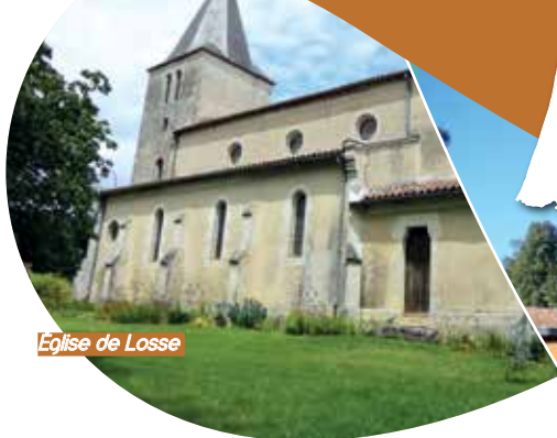
Eglise de Losse