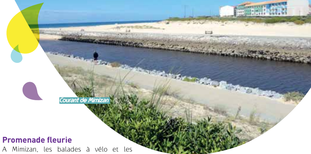
Courant de Mimizan