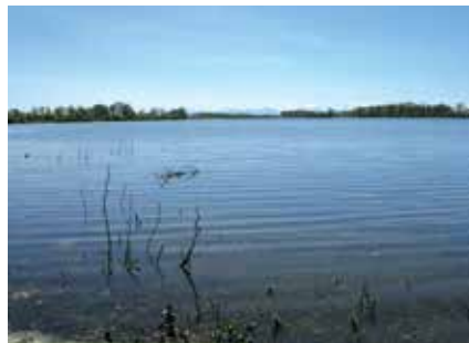
Lac de Miramont-Sensacq