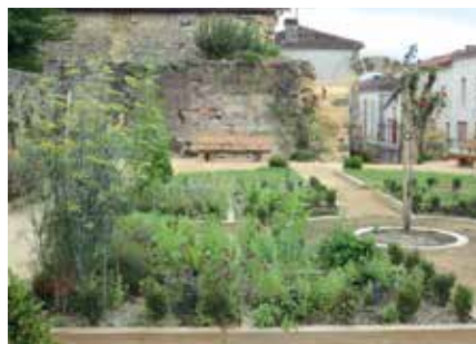
Jardin médiéval de Geaune

Dans l'ancien jardin du cloître des Jacobins, niché derrière la Tour des Augustins, la commune a redonné vie au jardin jadis entretenu par les moines. Délimité en quatre carrés, le jardin remet au goût du jour des essences aujourd'hui oubliées mais qui faisaient partie du quotidien à l'époque médiévale : plantes potagères, plantes médicinales, fleurs à consommer, céréales, plantes tinctoriales... La vigne est également présente et rappelle la tradition viticole du Tursan.