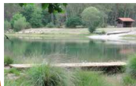
Lagunes de Nabias à Arue

Formées lors de la dernière glaciation, les lagunes étaient caractéristiques du paysage landais avant la plantation massive des pins. Aujourd'hui, ces petits plans d'eau sont rares et offrent un intérêt écologique avec leur faune et flore spécifiques (plantes carnivores telles que la drosera) dont les particularités sont expliquées tout au long du sentier d'interprétation de ce milieu humide aujourd'hui préservé.