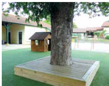
Arbre de l'école à Saint-Avit