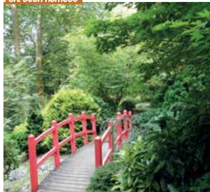
Parc Jean Rameau

Situé place Francis Planté et blotti dans un méandre de la Douze, le Parc Jean Rameau porte le nom d'un romancier landais du début du siècle dernier. Acquis par la Préfecture des Landes en 1812 pour la culture de nouvelles essences telles que le platane, le robinier, le chêne liège, le marronnier, etc. destinées à la replantation des barthes et marais landais asséchés, il devient jardin public de Mont-de-Marsan en 1895. Il présente aujourd'hui plus de 80 essences de très beaux arbres, ainsi que diverses ambiances avec ses jardins à thème : japonais, fougères, hydrangéas ou encore vivaces. Vous y découvrirez des végétaux remarquables dont plusieurs variétés de hêtre. Le parc accueille la Fête des Jardins, tous les ans, le dernier dimanche du mois d'avril, à laquelle participent plus de 80 exposants.