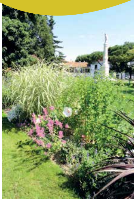
Square de la Mairie