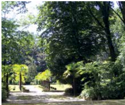
Parc du Sarrat

Visites uniquement guidées le mardi, le jeudi et le samedi à 15h30. Fermé de décembre à février. Ouvert lors des Rendez-Vous aux Jardins (juin) et des Journées du Patrimoine (septembre). Expositions à thème organisées chaque année.