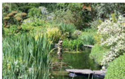
Jardin d'eden à Poudenx

Visite sur rendez-vous d'avril à octobre. Tél. 05 58 79 04 48