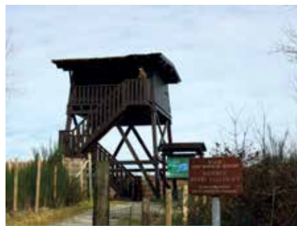
Barthes de Saint-Martin-de-Seignanx

Infos + Tél. 05 59 56 16 20 www.cpie-seignanx.com