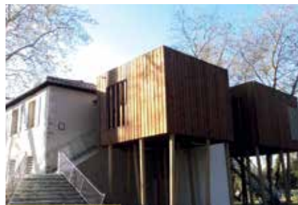
Maison de la Barthe