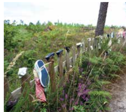
Ex-voto à Notre-Dame des Pins à Aurice

Un détour par la chapelle Notre-Dame des Pins, qui trône au milieu des osmondes royales, s'impose. Vous y découvrirez la fontaine miraculeuse à qui on attribue les pouvoirs de faire marcher les enfants et de réparer des infirmités. Pour preuve, de nombreux et curieux ex-voto !