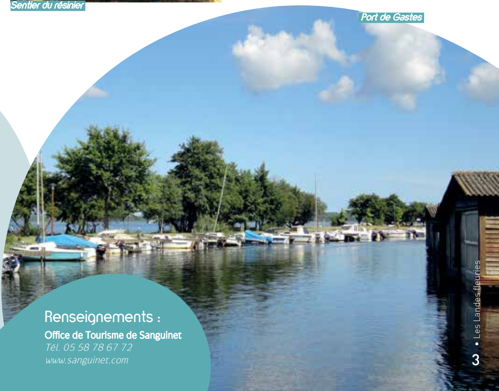
Port de Gastes

Accès libre. Visite guidée les mardis et jeudis en juillet et en août. Inscription auprès de l'Office de Tourisme.