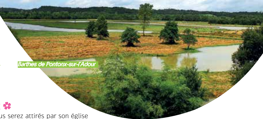
Barthes de Pontonx-sur-l'Adour

Observatoire ouvert en permanence. Visites guidées sur rendez-vous en compagnie de l'animateur nature du site. Tél. 06 07 98 66 01 www.pontonx.fr