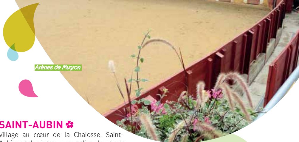
Arènes de Mugron