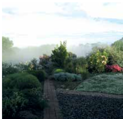
Jardin Symmons à Beyries

Visite sur rendez-vous. Tél. 05 58 79 05 49