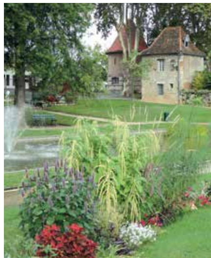
Parc de la Mairie de Saint-Paul-lès-Dax