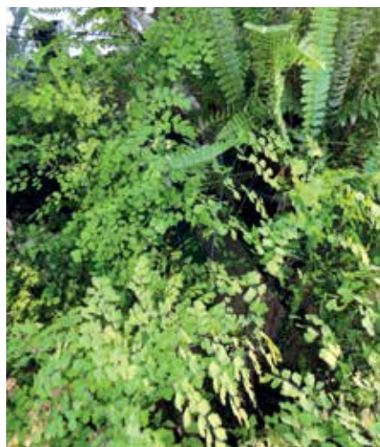
Fougères d'ici et d'ailleurs