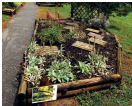
Jardin des Sens

Infos + Jardin ouvert de mi-juillet à mi-septembre. Visite libre du mercredi au vendredi l'après-midi. Visite guidée par un animateur-jardinier les mercredis et vendredis à 15h. Conférences, animations et sorties nature organisées tout au long de l'année par le CPIE. Tél. 05 59 56 16 20 www.cpie-seignanx.com