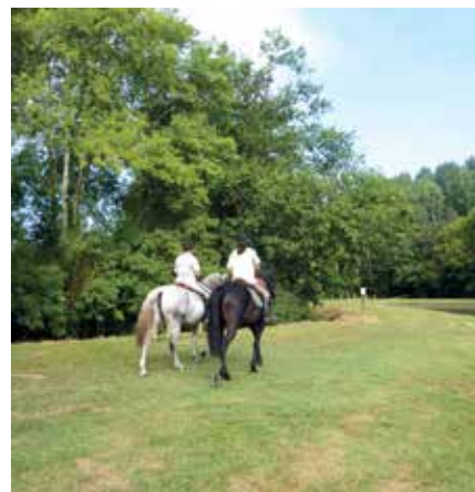
Gardes-nature dans les Barthes de Pontonx-sur-l'Adour