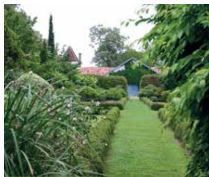
Plantarium® de Gaujacq