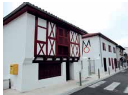
Maison de l'Oralité et du Patrimoine à Capbreton