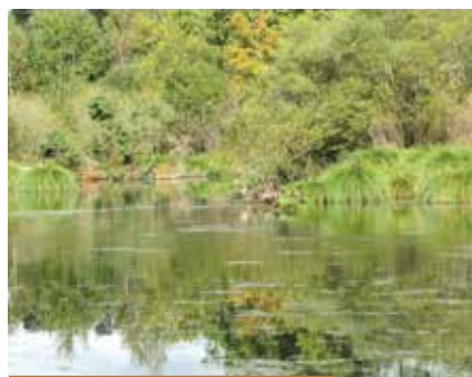
Site des Neuf Fontaines à Bostens

A travers un circuit pédestre et des panneaux thématiques, découvrez un patrimoine naturel et architectural typique des Landes de Gascogne. Un chevrier présent sur le site propose même la dégustation et la vente de ses produits sur place. Côté nature, s'est développée autour des trois étangs une mosaïque d'habitats naturels aujourd'hui préservés. On y trouve alternativement des herbiers aquatiques, des pelouses, des landes et plusieurs types de boisement. Cette diversité floristique favorise l'observation de nombreux animaux insolites, parmi lesquels l'emblématique Cistude d'Europe, tortue d'eau douce protégée.