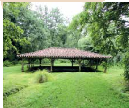
Lavoir de Laglorieuse

La fontaine Saint-Guirons à Laglorieuse datant de 1843 permettait de faire des ablutions de tout le corps à l'abri du regard ! En vous promenant vous pourrez découvrir aussi le vieux lavoir, apportant une note de fraîcheur dans un écrin végétal.