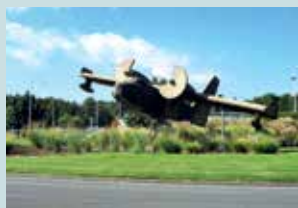
Rond-point de l'hydravion à Biscarrosse

Les jardiniers de la ville vous le rappellent dès votre arrivée !