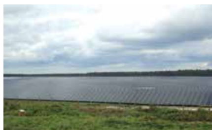
Ferme solaire de Losse

Depuis le bourg de Losse, un sentier de randonnée balisé vous mènera jusqu'à la source à la limite des quartiers de Lussolle et de Bergonce. Vous rencontrerez au passage un four restauré, un petit oratoire. Une croix de pierre posée sur un socle sculpté en 1895 indique ensuite la direction des trois sources dédiées à Saint-Georges et dont les vertus soulageaient bien des maux.