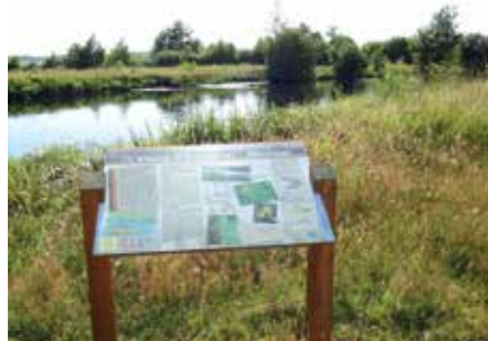
Sentier de Saint-Paul-en-Born

Départ du sentier près de la Gare de l'Art dans le bourg de Saint-Paul-en-Born. Distance : 9,5 km Durée approximative : 2h30 Topoguide disponible à l'Office Intercommunal de Tourisme de Mimizan.