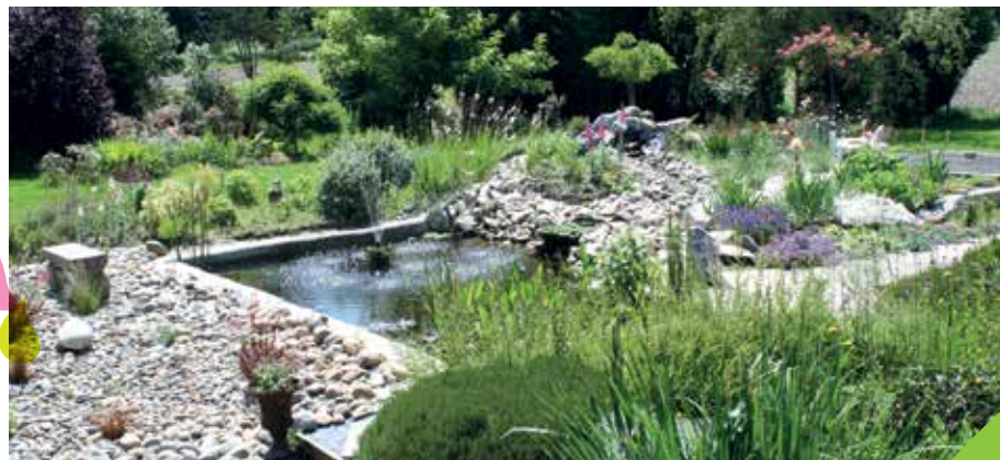
Jardin de Marie à Saint-Sever