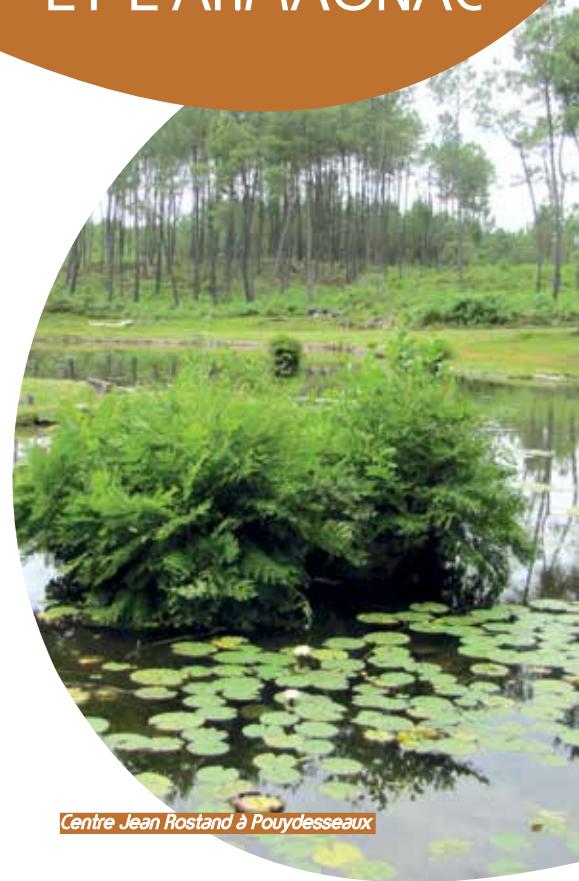
Centre Jean Rostand à Pouydesseaux