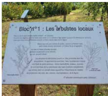
Arboretum de Morcenx