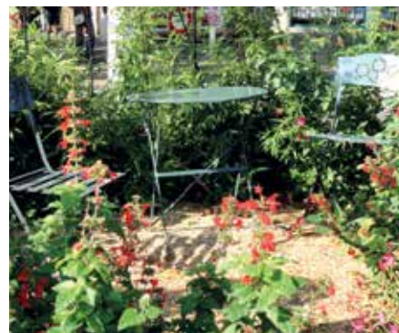
Centre-ville de Biscarrosse