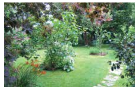
Jardin du chat qui s'en va tout seul

Visite sur rendez-vous l'après-midi. Tél. 05 58 77 73 80