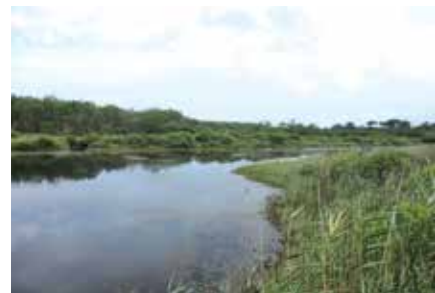
Sentier découverte des Etangs de la Mailloueyre

Départ de la maison forestière de Leslurgues, plage Sud de Mimizan. Distance : 3,6 km Durée approximative : 2h