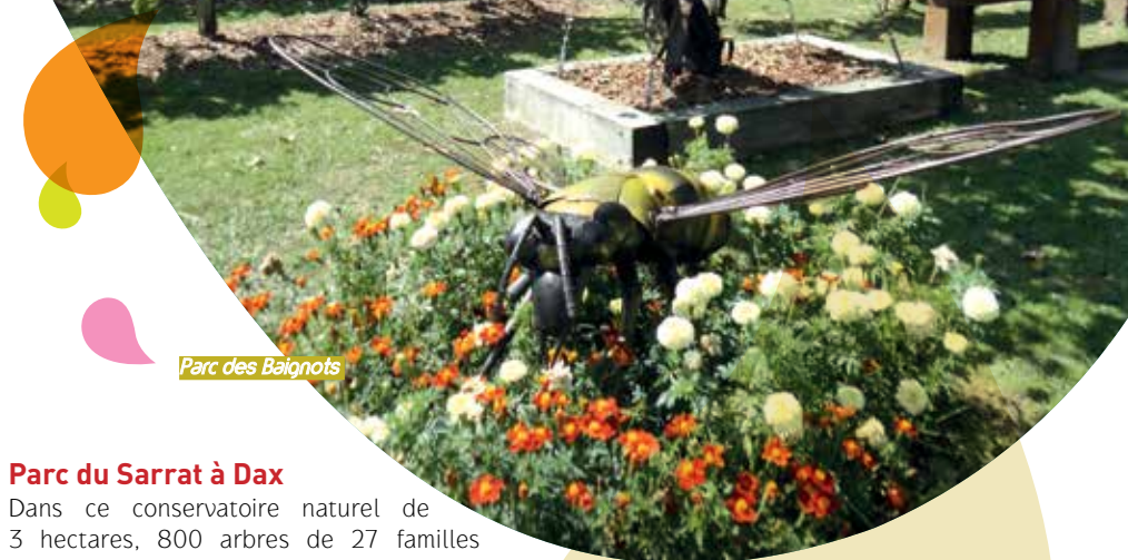
Parc des Baignots

Profitez des visites guidées organisées régulièrement par l'Office de Tourisme pour découvrir les parcs et les jardins à thème de la ville en compagnie des jardiniers.