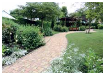
Square des Caçots

Tél. Mairie : 05 58 05 77 77 www.hagetmau.fr