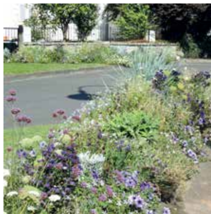
Centre ville de Saint-Paul-lès-Dax

Au Lac de Christus, les équipements et aménagements de loisirs ne manquent pas : parcours de santé, aire de fitness, aire de jeux pour les enfants... ont de quoi satisfaire pleinement les nombreux promeneurs qui fréquentent cet espace naturel.