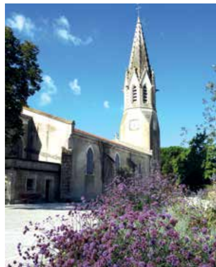
Eglise de Biscarrosse

Renseignements auprès de l'Office de Tourisme.