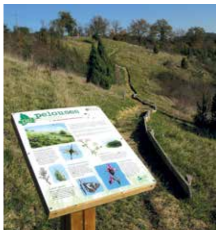
Sentier découverte du Coteau du Moulin

Sur les coteaux du Tursan, un sentier en accès libre vous permettra de découvrir la diversité de la faune et de la flore locales. La mosaïque de milieux entretenus par le pâturage, les espèces végétales d'affinité méditerranéenne et les insectes confèrent à ce site un intérêt écologique remarquable pour le Sud-Ouest. Et quel plaisir pour les yeux de découvrir, nichées sur ces pentes calcaires, des orchidées sauvages. Plus de 25 espèces différentes s'épanouissent tout au long de l'année. A admirer sans toucher !