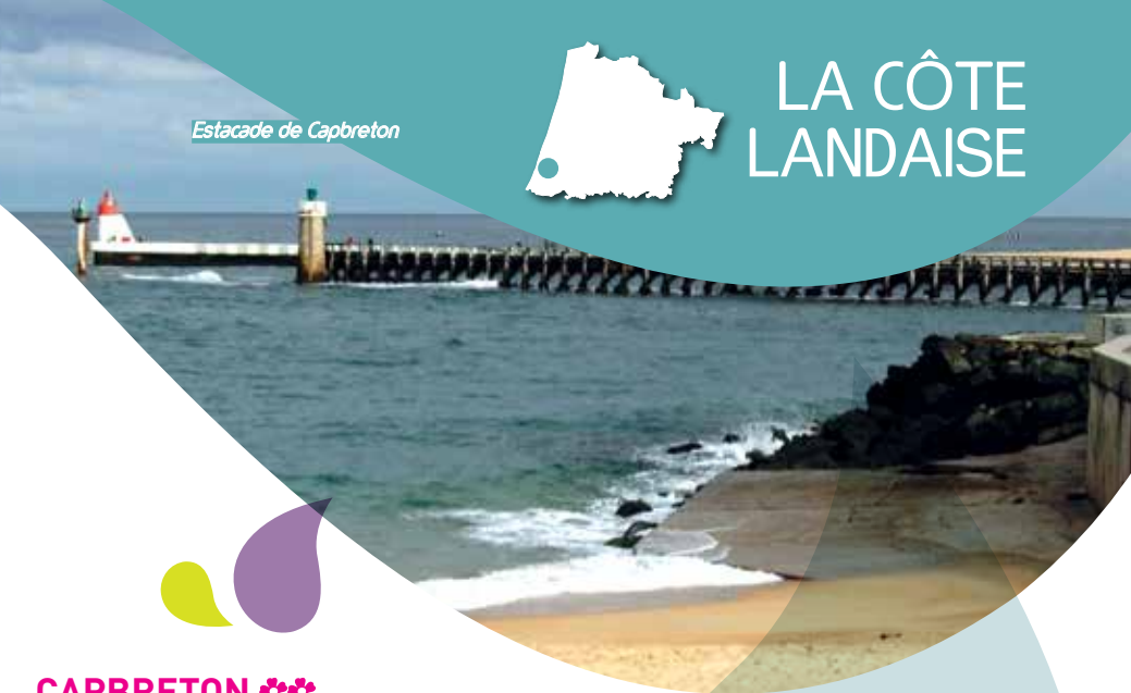
Estacade de Capbreton