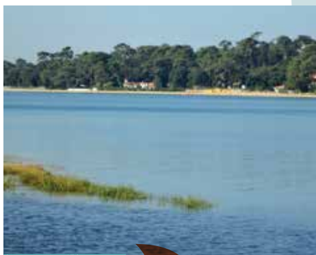
Lac marin d'Hossegor