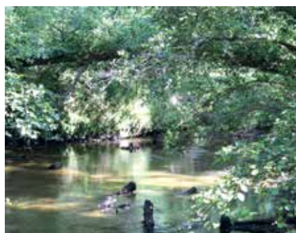
Sentier botanique de Villenave

Sur les bords du Bez, ruisseau de la Haute-Lande, un sentier balisé de 2 250 m permet de découvrir la quasi totalité de la flore caractéristique des différents habitats d'une « forêt galerie » landaise. Des passerelles de bois permettent de pénétrer dans un milieu humide.