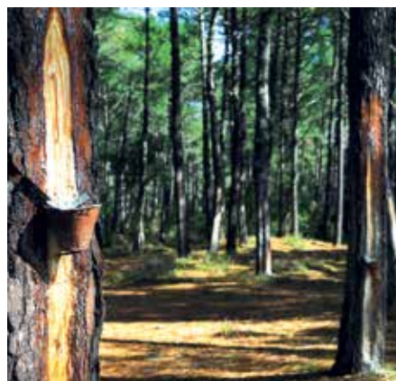
Sentier du résinier

Accès libre. Visite accompagnée par un gemmeur une fois par semaine en juillet et en août pour faire revivre ces gestes oubliés. Renseignements à l'Office de Tourisme.