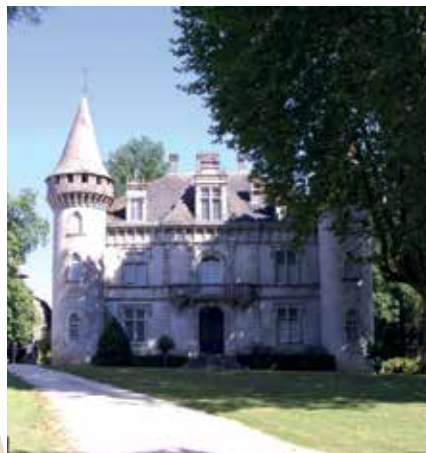
Château de Fondat à Saint-Justin

Tél. Mairie : 05 58 44 82 16 www.saint-justin.fr