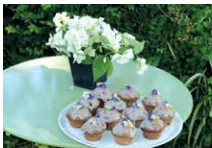
Cuisine aux plantes aux Jardins de Nigelle

http://lesjardinsdenigelle.over-blog.com