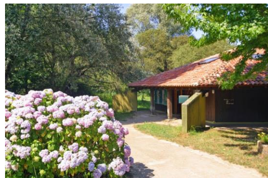
Maison de la Réserve Naturelle

Ce sentier quitte la D 337, au niveau du « Village Vacances CCAS » et emprunte la D 189, route Louis de Bourmont. Attention, cette partie de sentier jouxte le GR 8 durant quelques centaines de mètres.